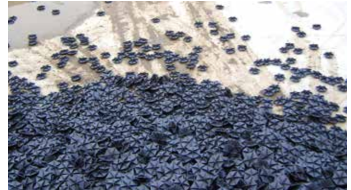
Hexa-Cover® : Installation i tom tank er muligt (max 5m faldhøjde)